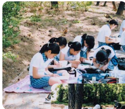
◀ 아이들 글 짓는 모습