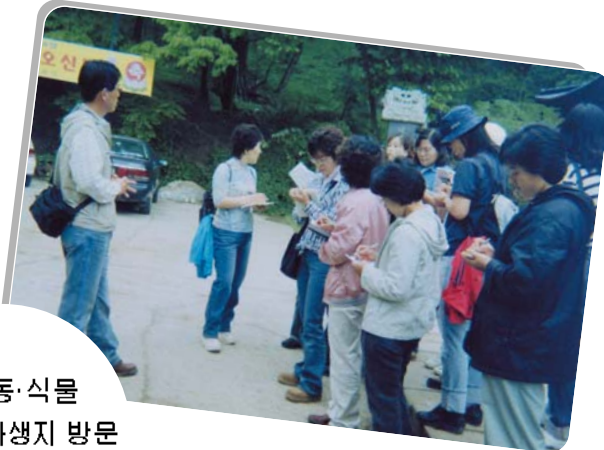
희귀 동·식물 서식 및 자생지 방문 환경의식 교육