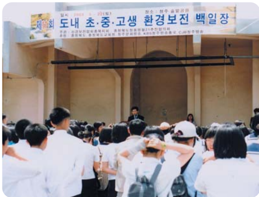
개회식 및 작품심사기준 설명