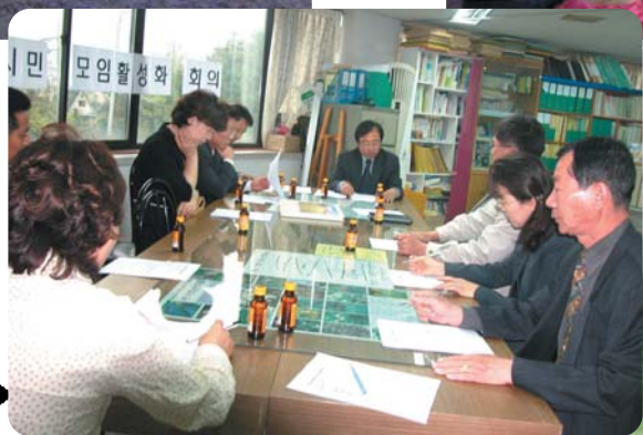
시민모임활성화 사업을 위한 준비회의 시민모임 회장단 및 관계자 회의