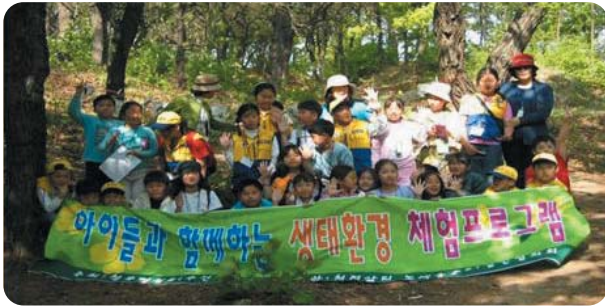
▲ 호암지 내의 숲 생태 관찰 및 자연 소품 만들기