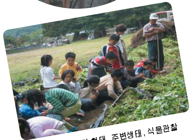
▲ 하천구조 및 형태, 주변생태, 식물관찰