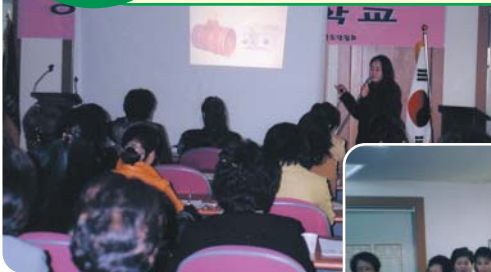
▲ 음식쓰레기 사례발표