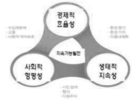
그림2. 지속가능발전 경제·사회·환경 3자간 통합모형