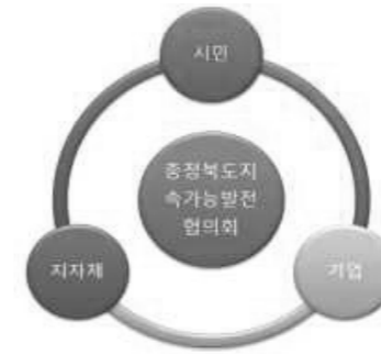
그림1. 지속가능발전협의회 구성요소